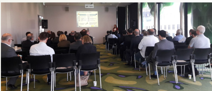
Angeles Valbuena presentando los mecanismos de colaboración con Australia durante la jornada tecnológica en la RMIT University, Melbourne