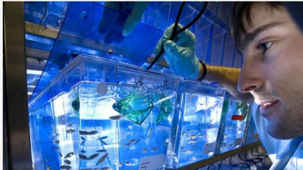
Imágenes del desarrollo del proyecto en laboratorio

Enmarcado en el Programa Bilateral Hispano-Chino de Cooperación Tecnológica (CHINEKA), gestionado por el CDTI y TORCH, se ha aprobado un nuevo proyecto, 'Maneras innovadoras de perfilar los extractos de hierbas medicinales tradicionales de China a través del pez cebrá (INNOCM)'. El consorcio está formado por la empresa española ZECLINICS, responsable principal del proyecto y Longhua Hospital de Shanghai.