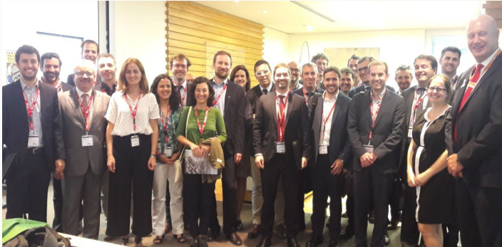
Los representantes de la delegación española

La actividad de CDTI durante el final del año 2017 en Australia estuvo marcado por la misión tecnológica en el sector ferroviario, organizada junto con MAFEX (21nov – 01dic) . Comenzando con la visita a Aus-Rail, el mayor evento del sector, se organizaron diversos encuentros con los principales organismos y gestores ferroviarios del país, así como dos jornadas tecnológicas con universidades australianas.