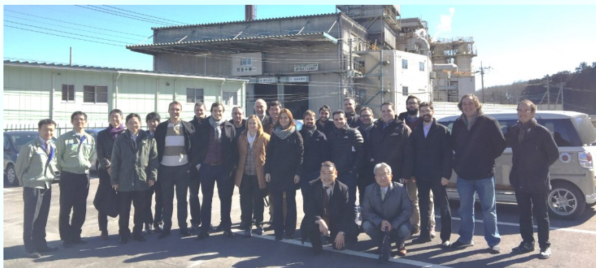
Representantes de la delegación española a Tokio.

Del 12 al 16 de febrero CDTI y NEDO han organizado un workshop sobre utilización y uso eficiente de energía en el sector industrial. CDTI junto con la Plataforma Tecnológica Española de Eficiencia Energética ha organizado una misión tecnológica que ha contado con la participación de ocho empresas, tres universidades y tres centros tecnológicos españoles.