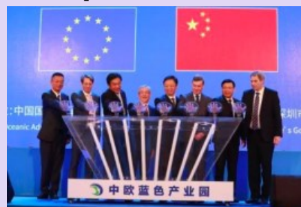
Representantes de la UE y de China en el acto de inauguración del "2017 China-EU Blue Industry"

La construcción del parque fue anunciada en el "2017 China-EU Blue Industry Cooperation Forum". Este encuentro supuso el primer evento celebrado entre China y la UE para la promoción y el intercambio de información en este sector. Asistieron más de 300 oficiales chinos, expertos y empresarios, y más de 60 representantes de la UE.