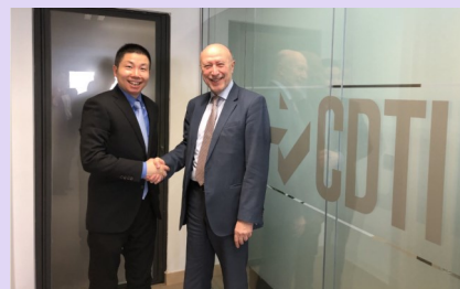
Imágenes del encuentro en la sede de CDTI, Madrid

El DG de CDTI se ha reunido con el presidente de la asociación internacional de parques y áreas de innovación (IASP) de la zona de Asia Pacífico. La reunión ha servido para presentar oportunidades de colaboración entre ambas instituciones. Se han establecido nuevas vías para el intercambio y difusión de información entre redes y parques de innovación tanto en España, donde IASP cuenta con su sede central a nivel mundial en Málaga, como en China.