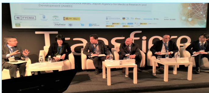
Mesa redonda en el Foro TRANSIFIERE 2019