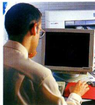
La investigación es fundamental

Pero en 1995 Sistema Azud empezó a vender fuera de España al sentir que aquí existía demasiada oferta y pocas posibilidades de crecimiento, y que en una economía globalizada apoyarse sólo en los mercados locales era cada vez más peligroso. Hoy la competitividad en los mercados exteriores es uno de los caballos de batalla de Azud. En este aspecto, la estrategia de la compañía es clara: desarrollar productos con un nivel tecnológico superior a los existentes en el mercado y a precios competitivos. «Somos conscientes de que sólo apos-