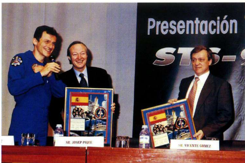
Visita a España de Pedro Duque, tras el vuelo STS-95 de la NASA

1998 has been a very good year for CDTI. Nationally and internationally, the level of Spanish company participation in the different programmes and initiatives managed by the Centre for the Industrial Technological Development has allowed 1997 results to be clearly surpassed, as well as results forecasted for 1998. Today the group of CDTI companies already totals 2,500, 15% of innovative Spanish companies, according to the National Statistics Institute of Spain.