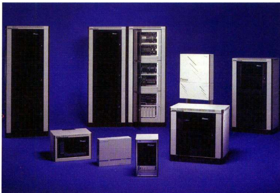
Sistema Dharma Call Center desarrollado por Datavoice.

“Tenemos que tener visión de futuro y las inversiones en I+D son fundamentales para sacar productos nuevos»