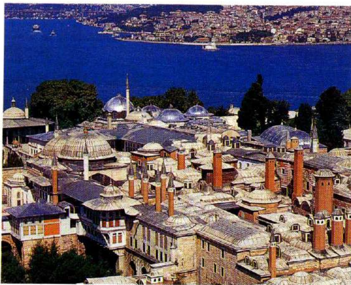
En junio se celebrará en Turquía la Expotecnia

También están en marcha otros proyectos como Ángel y Fastplan (ver Perspectiva CDTI,