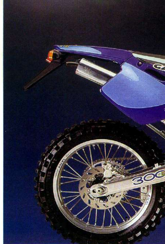
Durante 1998 la empresa fabricó 7.000 unidades.

Las ventas de esta firma catalana se dirigen fundamentalmente a los mercados exteriores (75%). Durante 1998, la compañía produjo 7.000 unidades, de las que en torno a 4.000 son de trial, 2.000 son modelos enduro y unas 1.000 Pampera. Francia, Inglate-