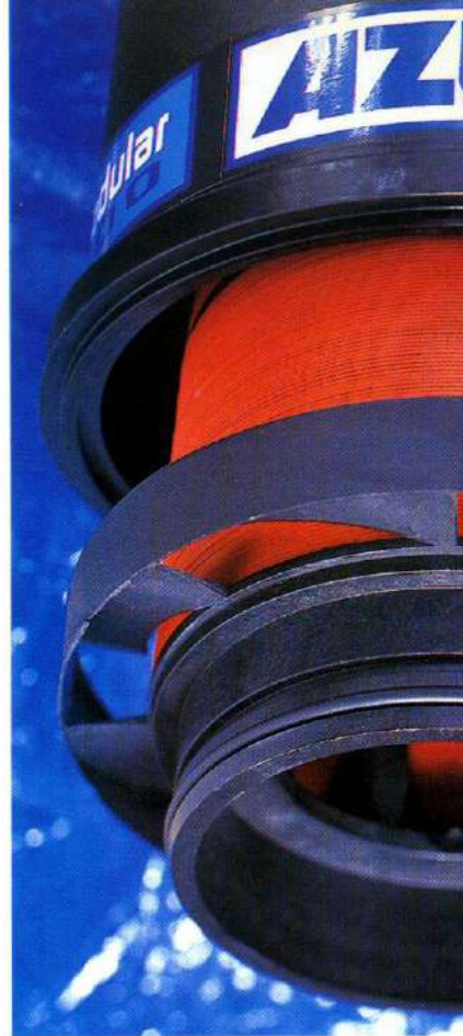
Cartucho autolimpiante de anillas

tando por la renovación tecnológica y la calidad se puede ganar la batalla comercial», comentan en la empresa. Esto es, la búsqueda de la competitividad internacional y de los nuevos mercados, ha sido el principal impulsor de un continuado proceso de innovación tecnológica que ha proporcionado excelentes resultados a Azud.