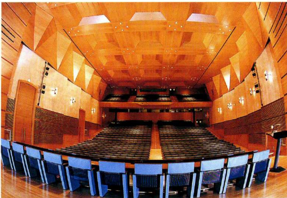
Palacio de Congresos y Exposiciones de Cádiz donde se celebrará la VIII edición de Tecnova

El próximo mes de mayo tendrá lugar la VIII edición de Tecnova. El evento, que se celebrará en Cádiz, abandona su fórmula tradicional de feria para convertirse en un congreso del que se obtengan conclusiones y resultados prácticos para el desarrollo tecnológico español.