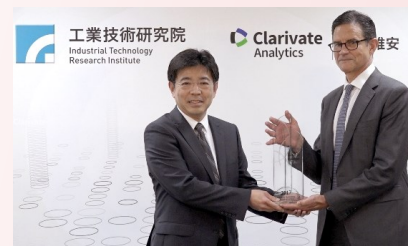
El presidente de ITRI recibiendo el galardón

El Instituto de Investigación de Tecnología Industrial respaldado por el gobierno de Taiwán ha sido ganador del último Clarivate Analytics Top 100 Global Innovators Award por su I+D y desarrollo de la propiedad intelectual. Más información