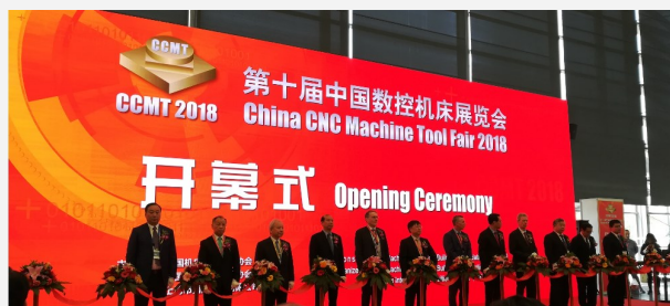
Acto de inauguración de la feria CCMT 2018

El pasado mes de abril tuvo lugar en Shanghai el mayor evento anual sobre la industria de la máquina-herramienta. Dicho evento que contó una gran presencia internacional, reunió a ocho empresas españolas y a la asociación de máquina herramienta AFM. La cita permitió a las empresas españolas mostrar sus servicios al mercado y evaluar el nivel tecnológico de la competencia.