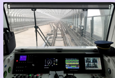
Imágenes de un viaje de prueba sin conductor

El proveedor de sistemas de control ferroviario en China, China Railway Signal and Communication Co., ha anunciado la creación de un laboratorio en Pekín, destinado a la investigación de la conducción autónoma en ferrocarriles. El objetivo marcado es que en 2022 circulen trenes de forma autónoma, que además solamente utilicen tecnología desarrollada en el país. Toda la información