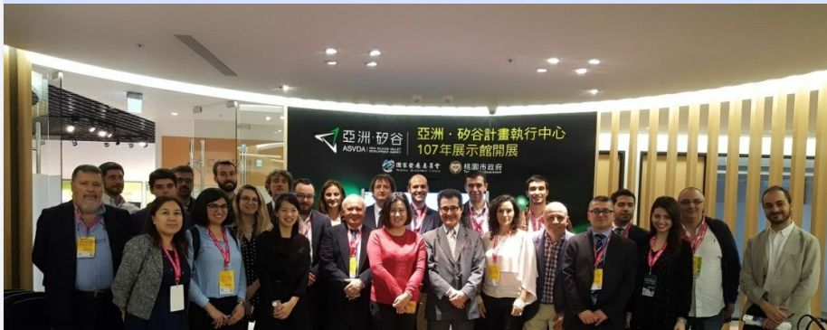
Miembros de la delegación en una de las visitas organizadas

La actividad de CDTI,E.P.E. en Taiwán durante el primer trimestre del año estuvo marcada por la Misión Tecnológica sobre Smart Cities, organizada en colaboración con SECARTYS el pasado mes de marzo de 2018 entre los días 26 y 30.